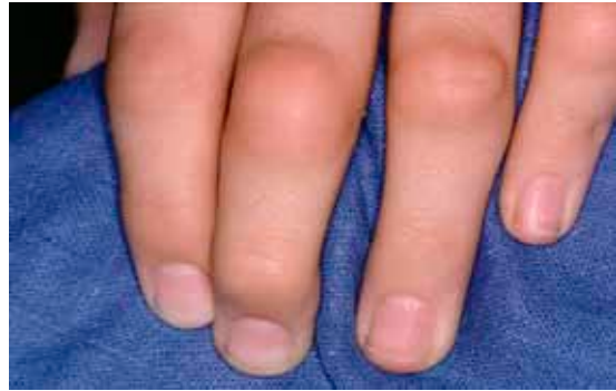
warme en gezwollen gewrichten

Als de ontsteking pas begonnen is, is de zwelling soms nog niet zo duidelijk. Je merkt bijvoorbeeld pijn onder de bal van je voeten bij het lopen, je hebt last van stijve vingers of opgezette handen.