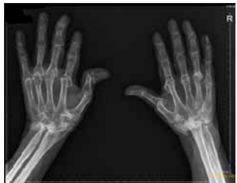
RX van handen met vergevorderde RA

Op een röntgenfoto is te zien of een gewricht is beschadigd. Meestal is dit pas te zien in een later stadium van de ziekte, maar bij agressieve vormen van reumatoïde artritis ook in het begin.